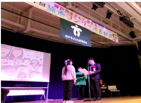
絵画コンクール表彰式

☑加入手続きに必要な書類など、全国子ども会連合会のホームページにご用意しております。また、ネットによる加入手続きもできますので、所属の都道府県・政令指定都市子連、および市区町村子連へご確認の上、ご活用ください。（全国子ども会連合会ホームページ参照）