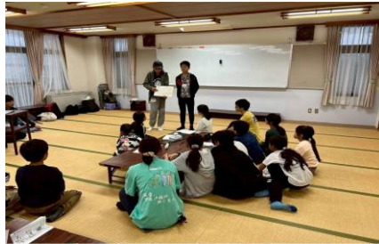
ジュニア・リーダー研修